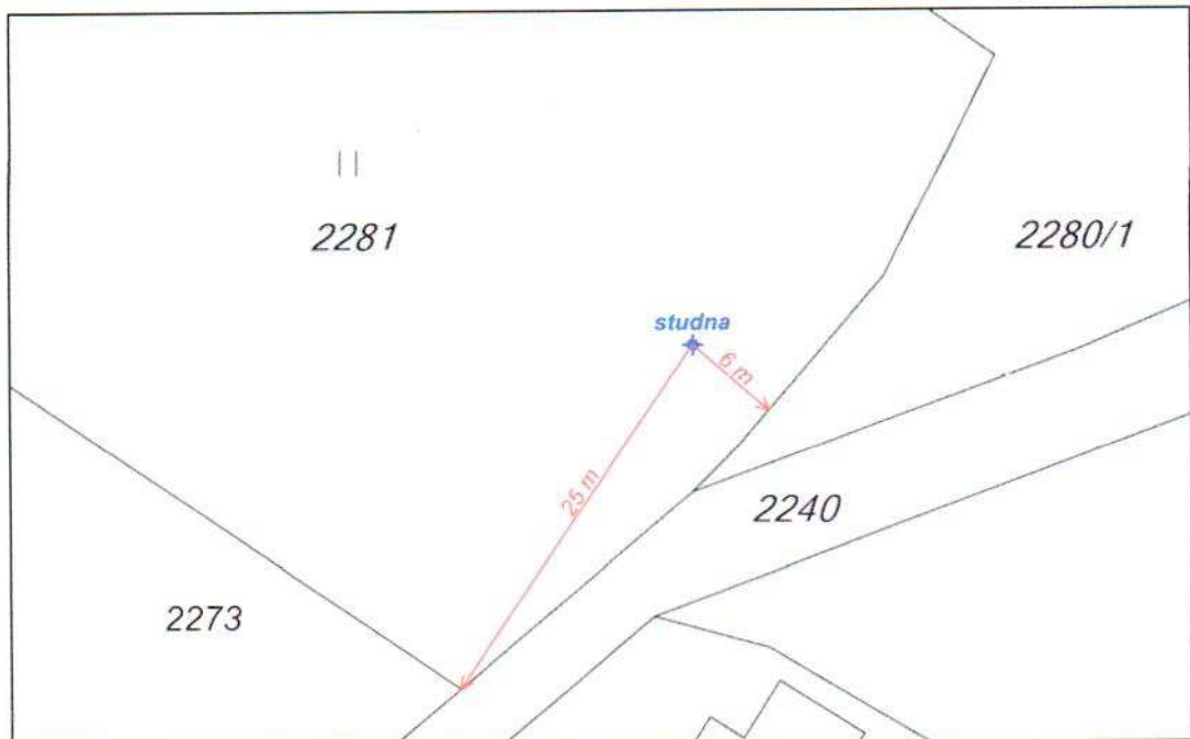
Obrázek 3: Zákres umístění projektované studny (měřítko 1 : 500, souřadnice S-JTSK studny odečtené z katastrální mapy: y = 717472, x = 1085225)